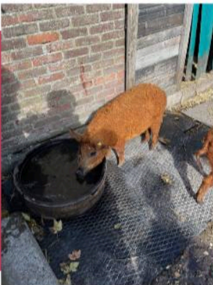
Bijzondere beesten -