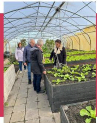
De nieuwe bakken