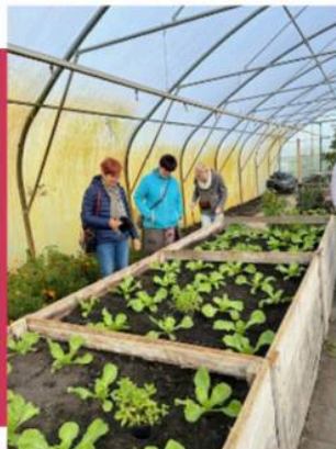
De oude bakken -